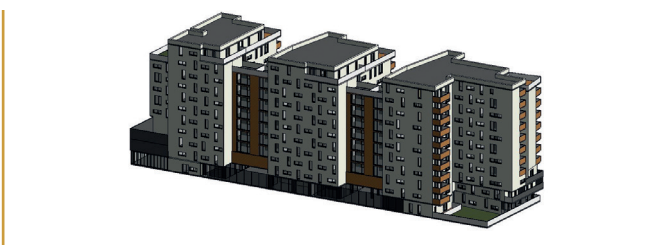
DIVISION EN VOLUMES / COPROPRIÉTÉ